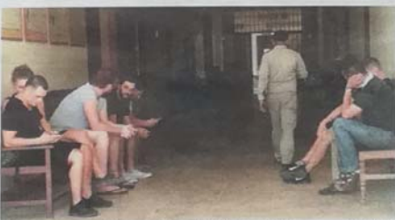
De arrestanten bij de rechtbank in Siem Reap.